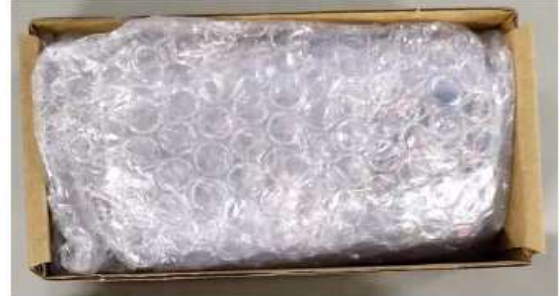
內盒包裝方式二：PE 袋散裝，PE 袋外裹氣泡紙，再放入小天地盒