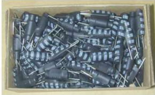
內盒包裝方式一：小天地盒散裝

內盒：小天地盒*24 個（天盒：15.5*8*4.5CM、地盒：14.5*7.5*4.5CM）